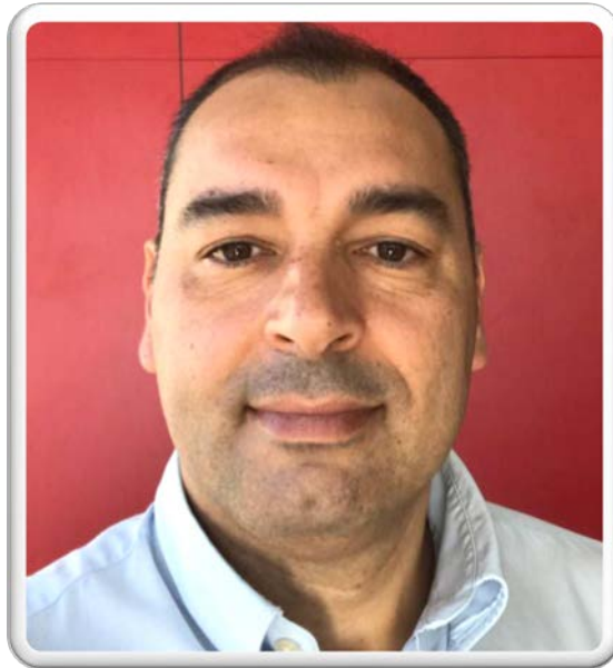
Professional Miner Bitcoin Maximalist Blockchain Developer Co-Founder